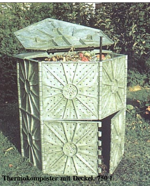
Thermokomposter mit Deckel, 750 l